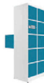
AI2225 10 Portas Dupla Face 32 x 32 x 45 cm