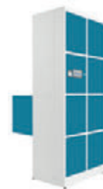
AI2224 8 Portas Dupla Face 32 x 41 x 45 cm